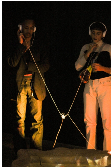
Bezoekers beluisteren het werk van Erik Peters in From then the Here