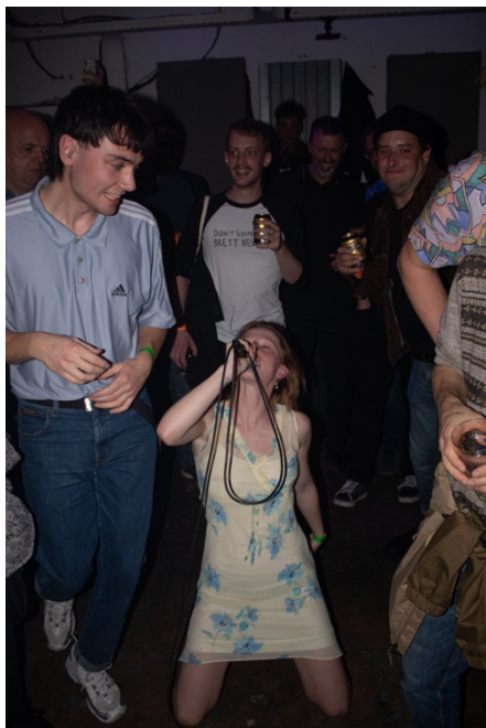
POM, tijdens Left of the Dial

Om fysieke binding te houden met onze trouwe achterban tijdens de lockdown konden deelnemers aan de online workshops materiaalpakketten ophalen bij de Burgertrut take-away en brachten we verschillende fysieke publicaties uit. Zodra we weer open konden hebben we samengewerkt met o.a. Rotown voor Left of the Dial en de Popronde, om ons ook voor het muziekpubliek weer als relevante locatie op de kaart te zetten.