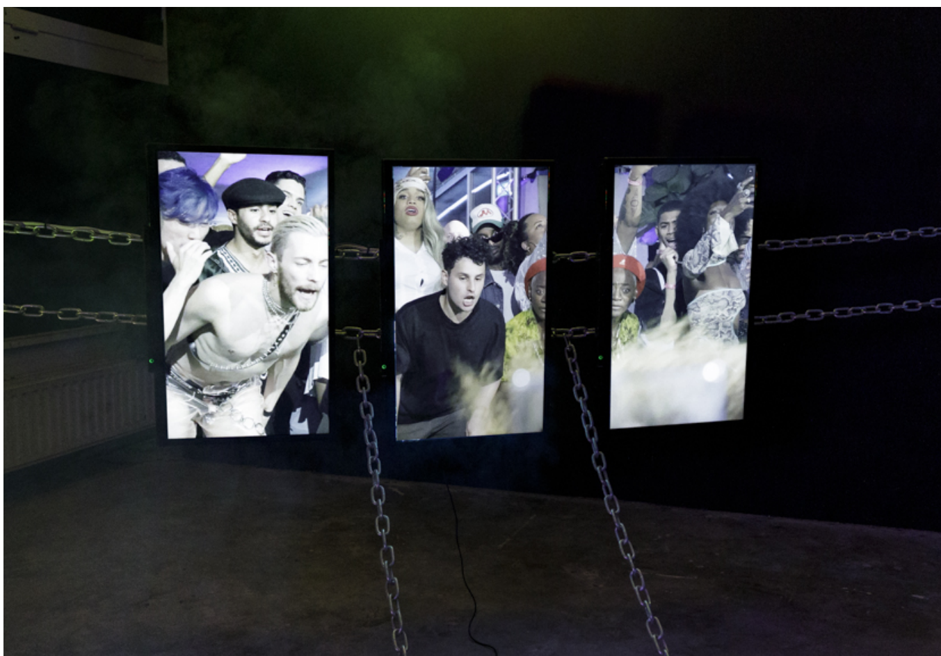
Video-installatie Queer Mercury onderdeel van tentoonstelling From Then to There van HCA-resident Erik Peters

Stichting Roodkapje Delftseplein 39 3013 AA Rotterdam www.roodkapje.org