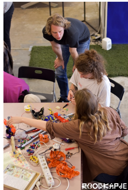
Deelnemers Workshop Electro Hacking